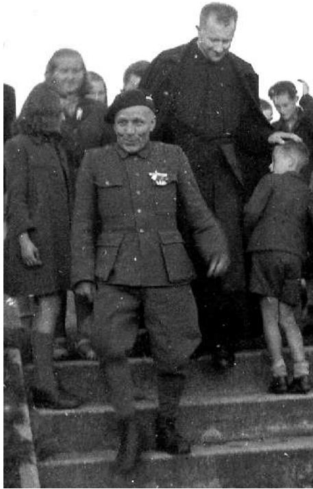
Po návratu z Dachau (1945)