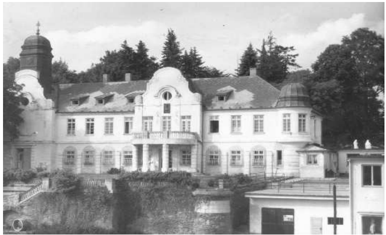
Záměček v Radvaně, místo internace v l. 1964-1965