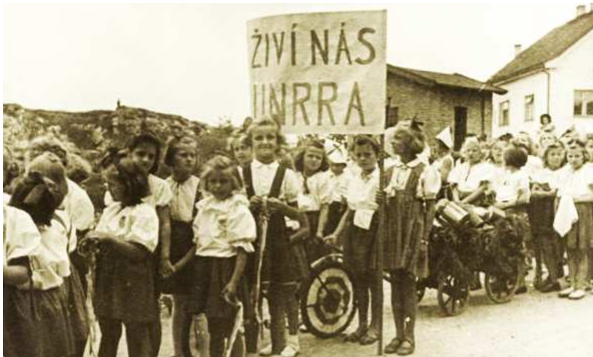
Ilustrace 1: Průvod žákyň Masarykovy obecné školy dívčí na Rokycansku u příležitosti Dne radosti mládeže 16. června 1946

žákyň jich dostávalo 86 stravu zdarma. Vaření bylo smlouveno v hotelu Český dvůr. Vyvažování probíhalo také v Obecné a měšťanské škole Mýto a v rokycanských školách Měšťanské škole chlapecké, II. Měšťanské škole chlapecké, Měšťanské škole dívčí a gymnáziu. Celorepublikového sběru plechovek od zboží UNRRA se účastnili také žáci Obecné školy Újezd u Radnic (Sv. Kříže), kteří byli v červnu 1946 poučeni o významu sběru těchto plechovek a následně poděleni odměnami.