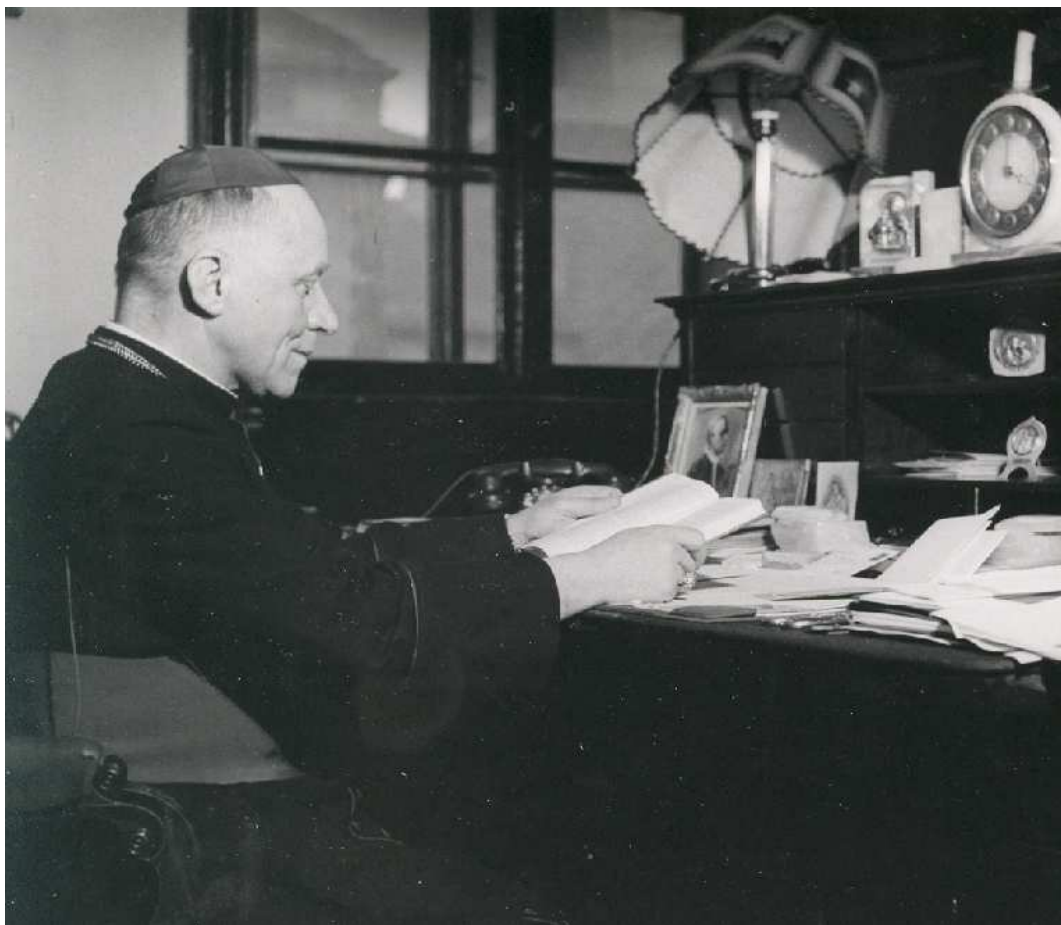
V pracovně arcibiskupského paláce (1946-1951)