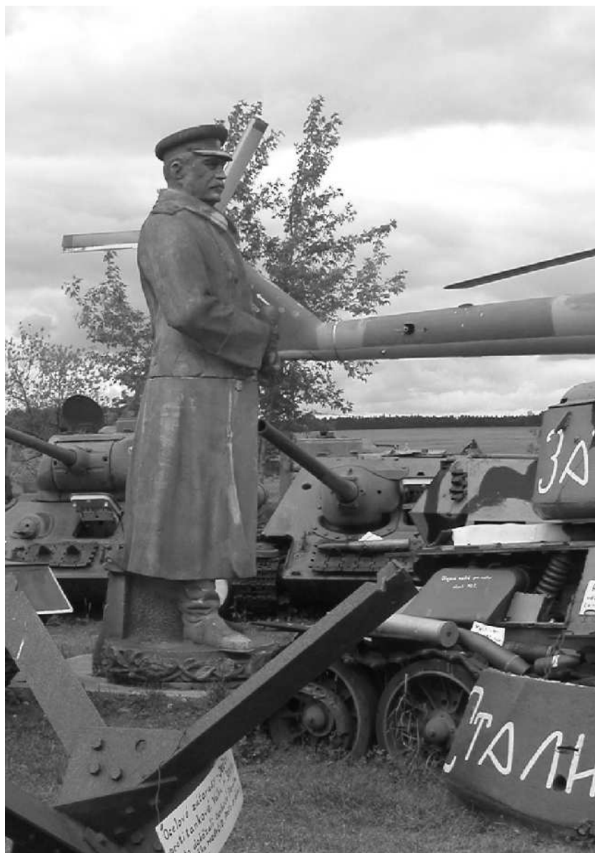
Stalinova socha v soukromém muzeu vojenské techniky ve Zruči.