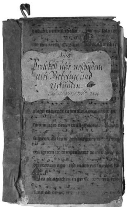
Vzhled knihy před restaurováním a po jeho dokončení. SOkADomažlice, fond AM Poběžovice, inv. č. 24 – Kniha různých zápisů, smluv a jednání před městskou radou, léta 1667-1760