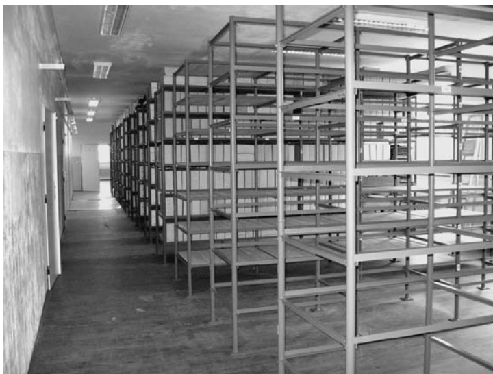
Budova SOA v Klášteře u Nepomuku. Prostory v křídle A1 během rekonstrukce a po jejím dokončení