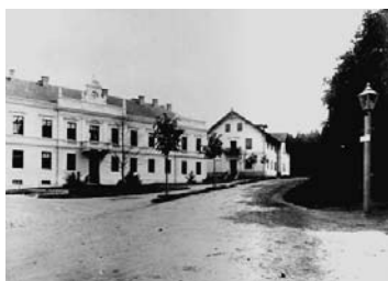
Nahoře: První lázeňská budova Dole: Staré lázně (vlevo), lázeňské vily Anna a Ervin

toužil navštívit proslulé toho času lázně sv. Vintíře v Dobré Vodě u Hartmanic. Poněvadž však pro pokročilou chorobu svou nemohl na cestu se vydati, byl nucen čekat, až bolesti trochu poleví. V této nesnázi zdálo se mu jednou, že v blízké bažině pod dutou jedlí prýští pramen léčivé vody, podobný onomu v Dobré Vodě. Když pak druhého dne pramen takový skutečně byl nalezen, dal se chorý ovčák k němu donésti a hle, po několika koupelích v křišťálové jeho vodě úplně ozdravěl. Z vděčnosti pak opatřil týž pramen kamennou sochou sv. Vintíře...“.